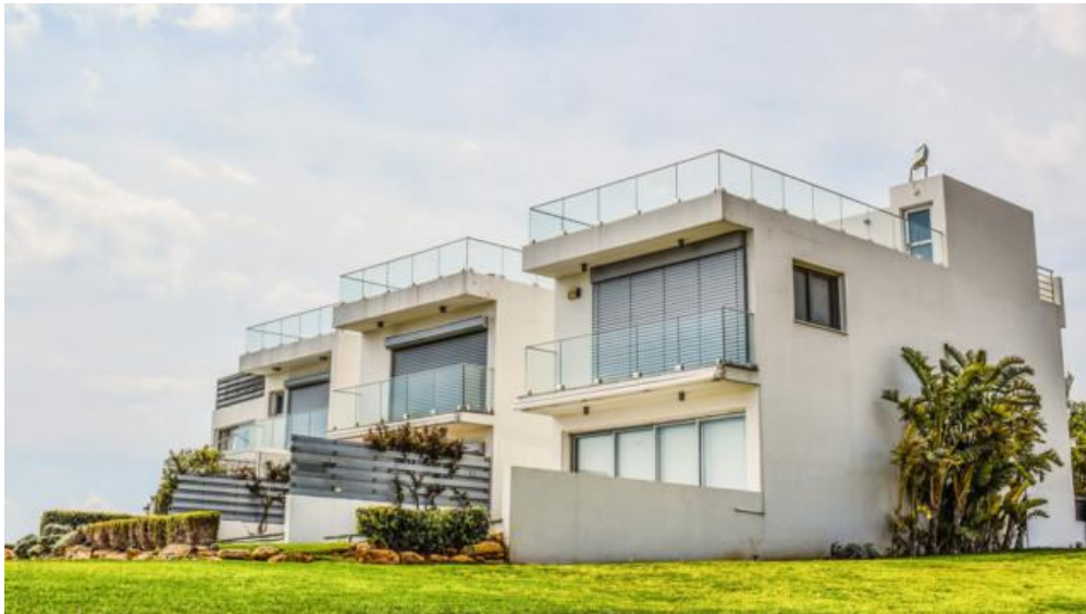
Priorität hat, den Reichtum zu bewahren.

Industriellendynastien aus dem In- und Ausland sind mit eigenen Holdings in der schweizerischen Auflistung der Family Offices aufgeführt – die Jacobs und Schmidheyns wie auch Brenninkmeijers der C&A-Modegruppe und die Schmuck-Swarovskis. Gut 70 Einträge sind es, wenn auch die Multi-Family-Offices mitgezählt werden. Sie versorgen jeweils mehrere Unternehmerfamilien mit Vermögens-, Rechts- und Steuerdiensten.